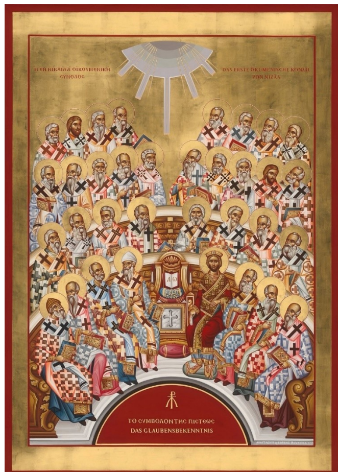
Nizäa-Ikone 2025 zeitgenössisch, gemalt von Anastasios Voutsinas und Eleni Voutsina, Thessaloniki 2024

Die aktuelle Konzilsikone der Orthodoxen Kirchen in Deutschland von 2024 zeigt das Erste Ökumenische Konzil recht statisch als Versammlung der orthodoxen Bischöfe halbkreisförmig angeordnet mit dem heiliggesprochenen Kaiser Konstantin (vorne rechts neben der aufgeschlagenen Bibel). Damit ist sie eine gute Beschreibung des neuen Machtanspruches des Kaisers in der Kirche. Das Konzil wird hier vom Heiligen Geist inspiriert dargestellt, der von oben die Versammlung erleuchtet. Es eine unpolemische Beschreibung des Konzils. Die Heilige Schrift in der Mitte mit dem Alpha und Omega weist auf Jesus Christus als das Wort Gottes hin. Er steht im Mittelpunkt der Versammlung von Nizäa, so wie er in der Mitte unseres Lebens steht. Auch die versammelten Bischöfe tragen je eine Bibel, da sie Lehrer und Hüter des Evangeliums sind. In der ersten Reihe sieht man (von links) die heiligen Bischöfe Spyridon von Trimitus (erkennbar an seiner geflochtenen Kopfbedeckung), Alexander von Alexandrien, Nikolaus von Myra, Eustathius von Antiochien, Athanasius von Alexandrien (als Bischof abgebildet, da er, auch wenn er zur Zeit des Konzils erst Diakon war, im Gedächtnis der Kirche als Bischof verehrt wird), Alexander von Thessaloniki und Makarius von Jerusalem. Unten in der Bildmitte das Christusmonogramm und der Hinweis auf das wichtigste Ergebnis des Konzils „Das Glaubensbekenntnis“.