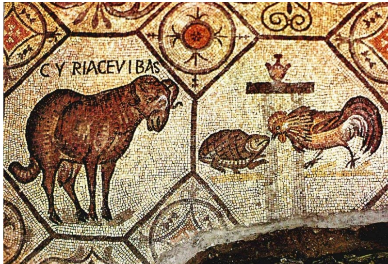
Der Mosaikausschnitt ist einem älteren Buch entnommen: Luigi Marcuzzi, Aquileia, Kunst und Geschichte, Verlag Foto Ghedina – Cortina, S. 32.

Zeitlich am Nächsten kommen dem Konzil von Nizäa die zeitgenössischen Mosaiken von Bischof Theodoros in der Basilika von Aquileia aus dem 4. Jahrhundert. Der kämpfende Hahn und die Schildkröte stehen hier für den Kampf zwischen dem anbrechendem Licht und der Finsternis und damit für den Sieg der nizänischen Partei über gotische „Arianer“ bei der Synode von Aquileia 381, mit dem Siegespreis in einer Amphore darüber. Es ist ein authentisches und damals populäres Bild von der Heftigkeit und Erbitterung der arianischen Streitigkeiten im Anschluss an Nizäa 325. Der Widder auf der Darstellung daneben ist als reines Opfertier (1.Mose 22,13 und 3.Mose 5,14-16) das allegorische Symbol für das Sühnopfer von Jesus Christus, um das in Nizäa gestritten wurde.